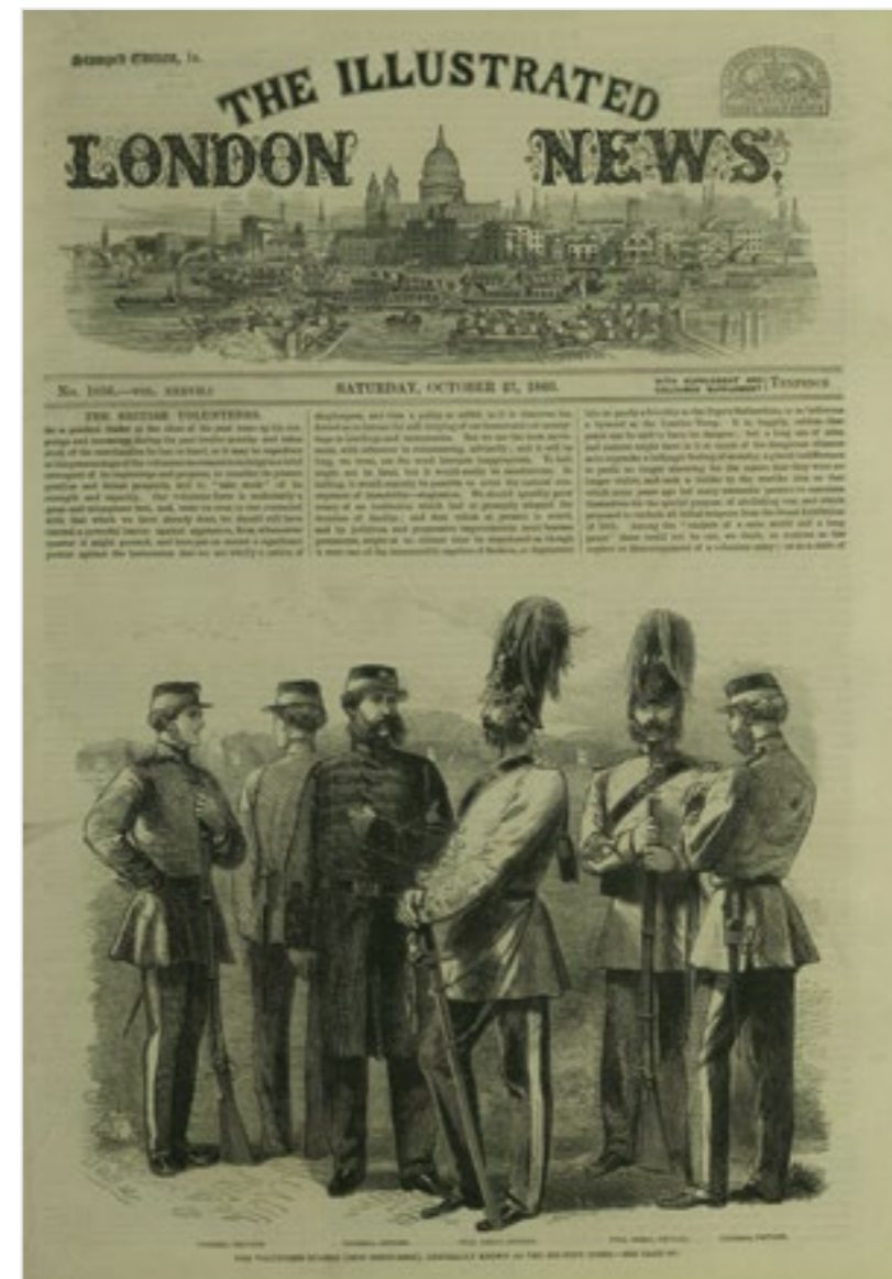
Illustrated London News , October 27, 1860