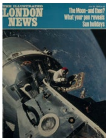
Illustrated London News, 26 July 1969