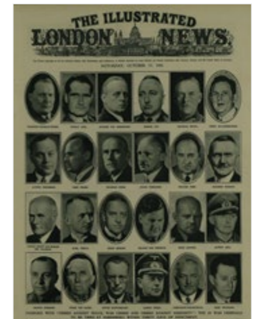
Illustrated London News , October 27, 1945