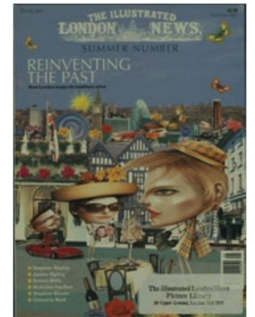
Illustrated London News , July 07, 2003